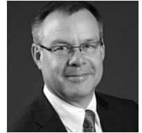
PIERRE PICHÉ Vice-président Power Corporation du Canada